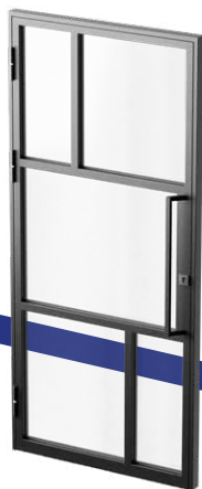
Antaba z pochwytem i zamkiem

Klamkę można zastąpić stalową, pionową antabą (do wyboru wersja z zamkiem baryłkowym lub bez zamka). Drzwi posiadają stalowe, wstawane, łożyskowane zawiasy gwarantujące ich płynną pracę.