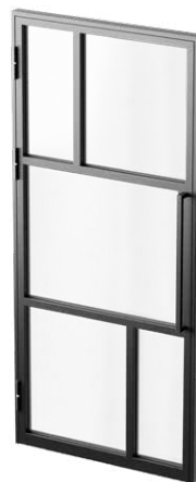
Antaba z pochwytem bez zamka